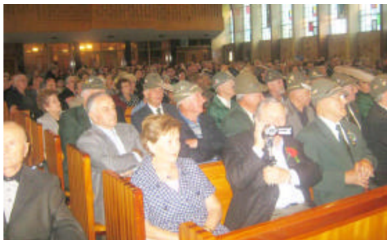
Chiesa affollatissima durante il concerto, oltre 600 persone.