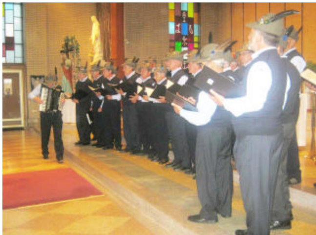
Il Coro mentre si esibisce nella chiesa di St. Antonio

Hamilton -Dietro i febbrili preparativi che hanno caratterizzato l'impegno degli Alpini di Hamilton e la Federazione Abruzzese per la manifestazione corale che avrebbe presentato non solo alla comunità abruzzese ed alpina locale ma